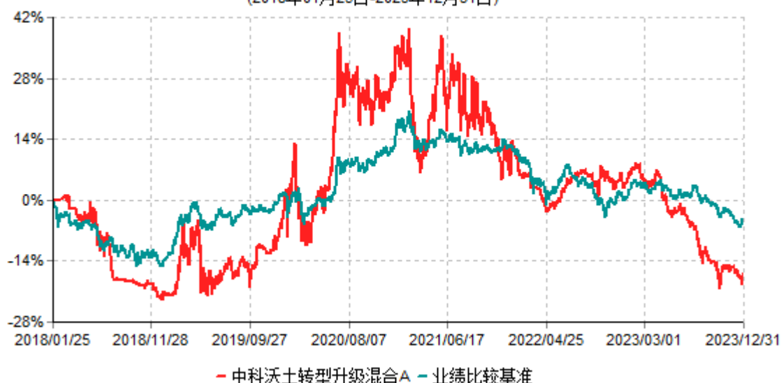
中科沃土转型升级混合A累计净值增长率与业绩比较基准收益率历史走势对比图 (2018年01月25日-2023年12月31日)