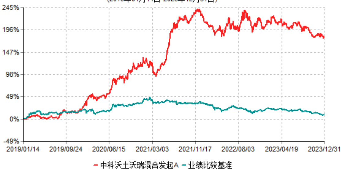
中科沃土沃瑞混合发起A累计净值增长率与业绩比较基准收益率历史走势对比图 (2019年01月14日-2023年12月31日)