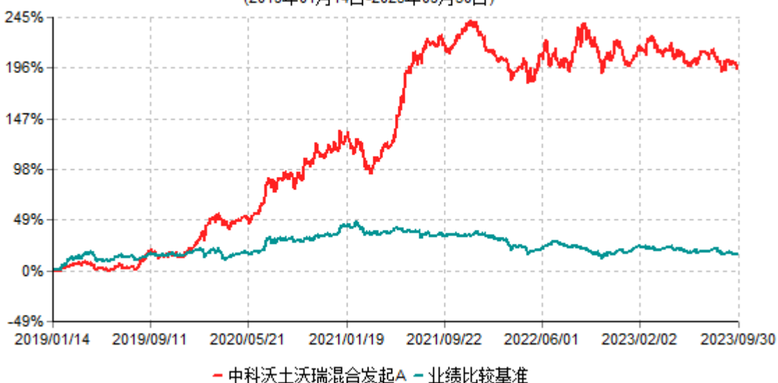
中科沃土沃瑞混合发起A累计净值增长率与业绩比较基准收益率历史走势对比图 (2019年01月14日-2023年09月30日)